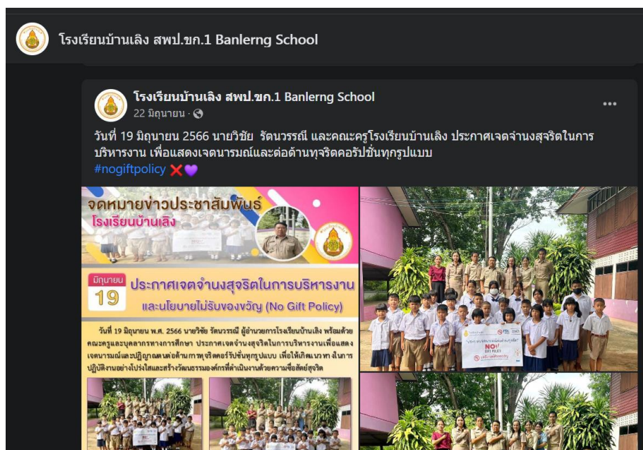
ประกาศนโยบาย No Gift Policy หน้าเว็บไซต์เฟสบุ๊กของโรงเรียน